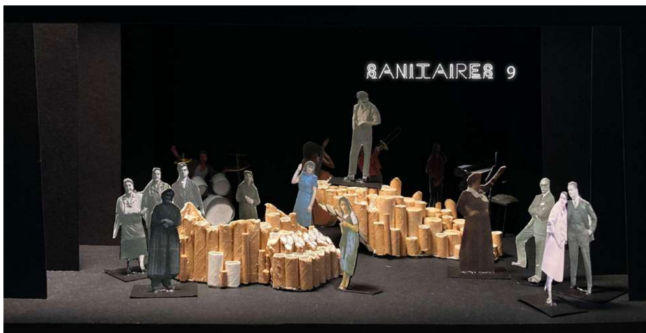
La maquette du décor ici placée pour faire exister les sanitaires numéros 9

La scénographie choisie, conçue et construite par Théo Phelippeau, fait la part belle à ce qu'est la pièce : un affrontement entre deux mondes, absurde, référencé et ingénieux. L'idée était de pouvoir faire exister deux mondes, et 4 espaces principaux, en un minimum de place et de matériaux neufs. Nous avons donc conçu une scénographie composée de trois modules dont chacun possède deux côtés : l'un représentant le côté riche de la ville, l'autre le côté pauvre. Un module en escalier permet une prise de hauteur signifiante pour les luttes de pouvoir en jeu dans la pièce, et la fluidité de déplacement des modules permet des changements à vue rapides et signifiants. La base des constructions sont des tubes en PVC recyclés, rappelant tantôt les égouts dans lesquels les rebelles se cachent, tantôt les mobiliers rutilants des années 50, faits de cylindres dorés. À cela s'ajoutent des néons pour indiquer le lieu où nous sommes, comme pour ajouter à l'absurde de la situation, et surexpliquer au public - dans un côté très bande-dessinée - où nous nous trouvons à chaque scène. Le quatrième mur étant souvent brisé dans la pièce, ces néons deviennent des appuis de jeu pour les comédiennes et comédiens, interagissant avec le public à leur sujet.