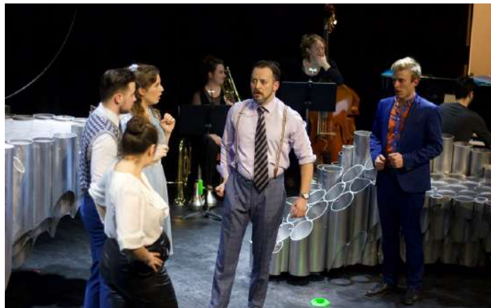
la troupe lors du filage devant les scolaires de Bourg-la-Reine

“Tu ne crois pas que les gens adorent qu’on leur dise que leur mode de vie n’est pas soutenable ?” dit ironiquement l’Officier Veyreau à la fin de la pièce. Le propos de Urinetown tient finalement en quelques mots : l’épuisement des ressources est inévitable dans un monde capitaliste... mais aussi dans un monde où rien n’est prévu pour réguler. D’aucun y voient ici la nécessité de politiques publiques drastiques pour la gestion de l’eau, d’autres l’échec du modèle révolutionnaire marxiste... Si politiquement la fin de la pièce laisse au public un goût amer, il lui permet de réfléchir à quel système social est le plus juste face aux enjeux climatiques d’aujourd’hui. Gestion privée ou public, par le peuple ou les autorités, punitif ou non...; autant de thèmes abordés dans la pièce, d’abord sous l’angle du rire puis plus sérieusement. On le sait, aujourd’hui, la question de l’eau devient cruciale dans le débat politique : à l’heure où l’eau potable est utilisée bêtement à certains endroits du globe et manque cruellement à d’autres, la question de la répartition des ressources est terriblement actuelle , que l’on parle de ressources naturelles ou économiques.