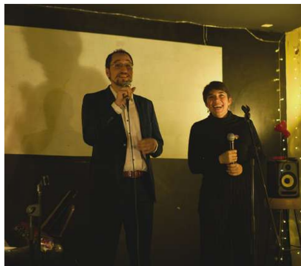
l'équipe lors du concert de lancement en décembre 2023