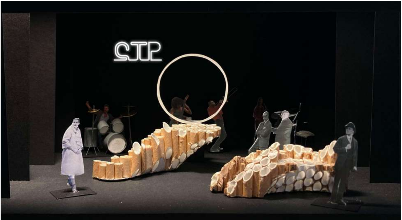
La première maquette du décor de la Corporation des toilettes Publiques