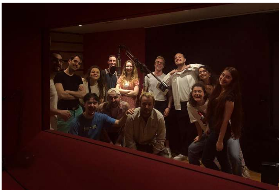
Enregistrement STUDIO - "Qu'est-ce que Tupisla ?"

Pour promouvoir le spectacle et sa troupe, nous avons décidé de créer une vidéo sous le format "clip musical" d'une des chansons extraites du spectacle. Intitulée "Qu'est-ce que Tupisla ?", ce titre permet d'apercevoir le ton et l'esprit du spectacle sans pour autant en dévoiler tout l'intrigue. Après avoir enregistré les voix en studio, nous avons pu tourner ces images avec le soutien de la ville de Chassy, accompagné par une équipe de tournage qui a su donner vie à l'univers de la pièce en vidéo.