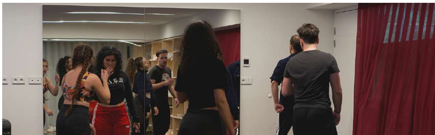
L'équipe en répétition