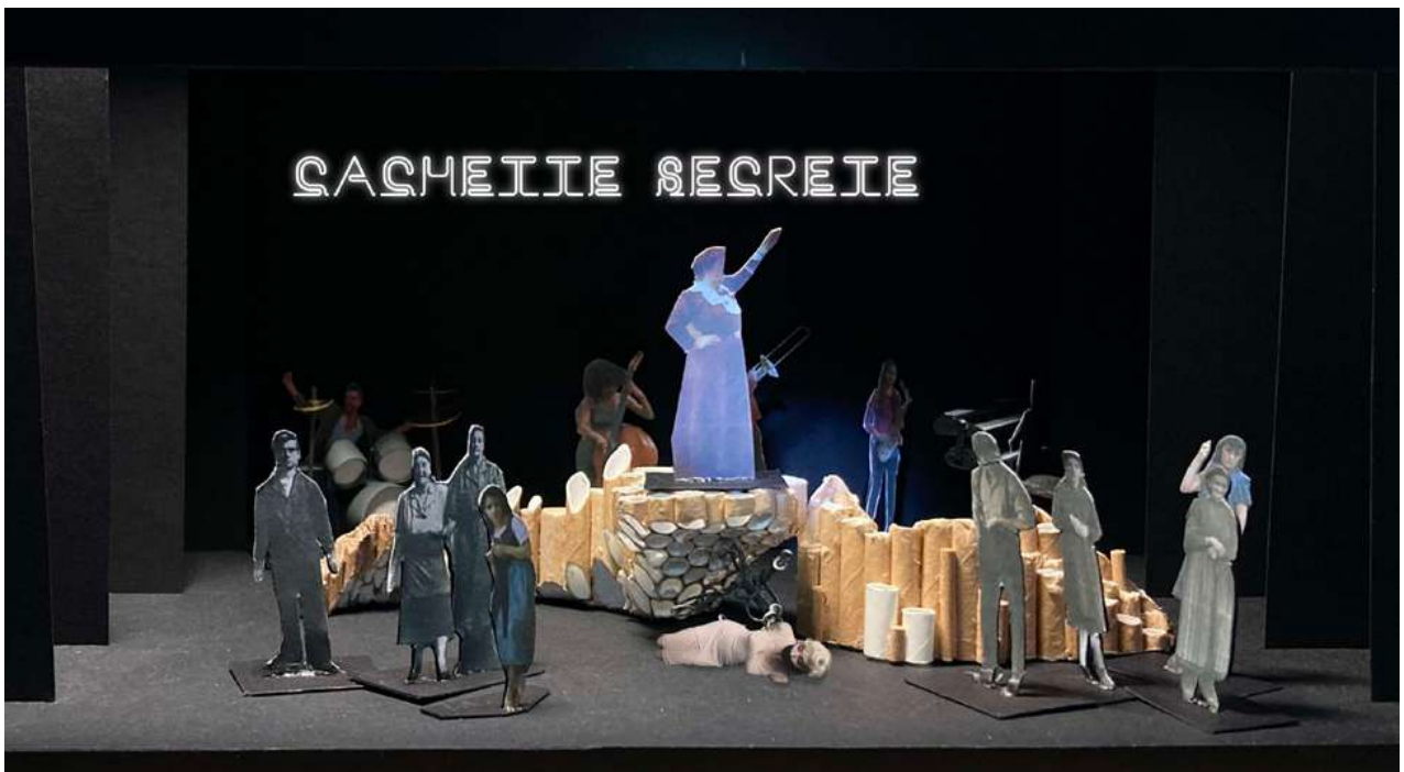
La première maquette du décor de la cachette secrète, quartier général des révolutionnaires